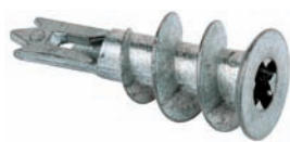
GKM kovová hmoždinka pro sádrokarton