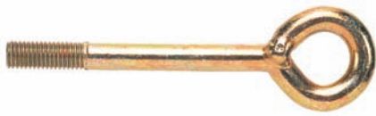
FI G 12 lešenářská kotva s okem