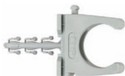
SF plus RC trubková příchytky