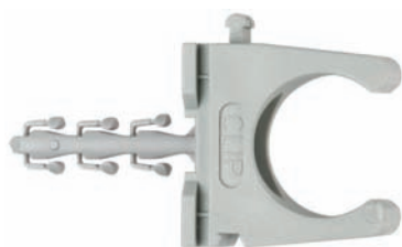
SF plus RC trubková příchytky ClipFix