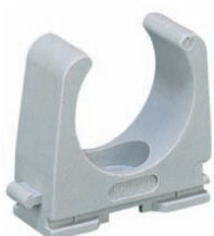
RC IEC trubková příchytka