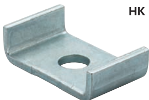
HK upínací podložka