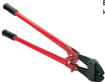
BOL N kleště pro dělení T šroubů

BOL N kleště jsou vhodné jak pro štípání T šroubů s přerušovaným závitem, tak pro tradiční šrouby se závitem M8 / M10.