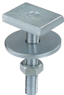
HS 38 šroub lištový